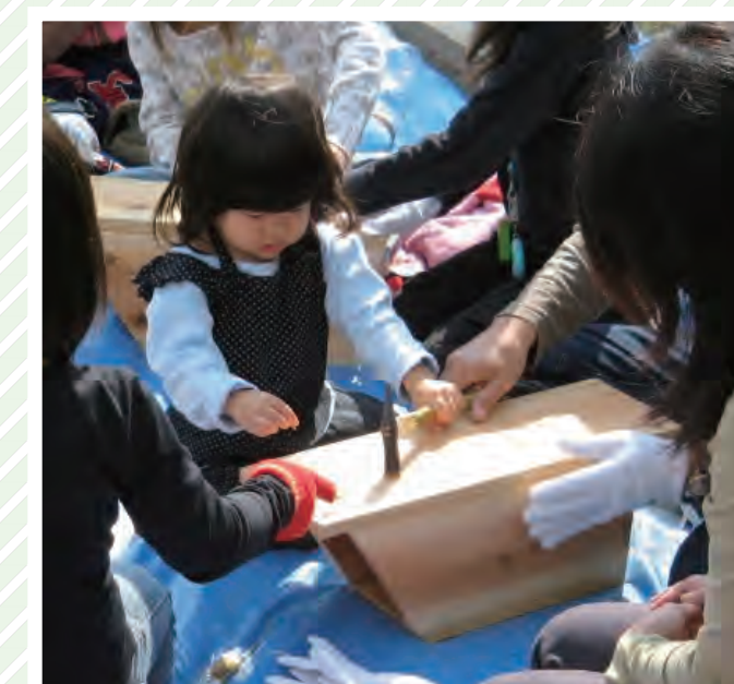
▶子どもたちもクラフトや巣箱づくりに挑戦(休暇村讃岐五色台)