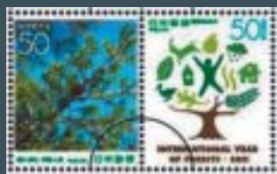
5月20日発売の記念切手

4月14日に開催された第2回国内委員会では、委員の方々の豊富な経験に基づき、復興に向けた様々な提案がありました。